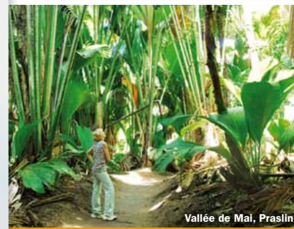
Vallée de Mai, Praslin