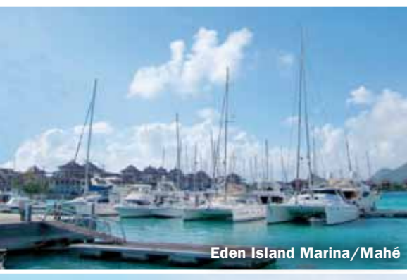
Eden Island Marina/Mahé