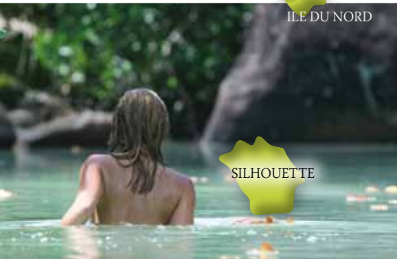
ILE DU NORD