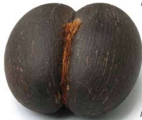
Coco de Mer