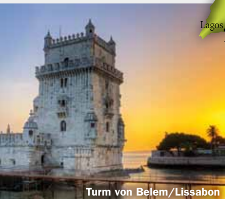
Turm von Belem/Lissabon