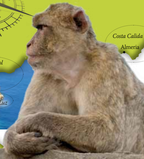
Costa Calida Almeria