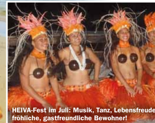
HEIVA-Fest im Juli: Musik, Tanz, Lebensfreude, fröhliche, gastfreundliche Bewohner!